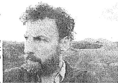
Wim Vandekeybus. 'Dat iemand onverschillig is tegenover wat we doen, verdraag ik niet.'

Kinderen voelen snel aan wat het is om op een scène te staan. En ze hebben een reptielengeheugen. Loopt er iets fout, dan is dat eventjes erg, maar vijf minuten later gaan ze alweer vol energie aan de slag. Terwijl professionele acteurs en dansers veel sneller vastzitten als er iets verkeerd gaat.